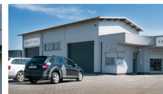
STYLE Polsko (servis & prodej)