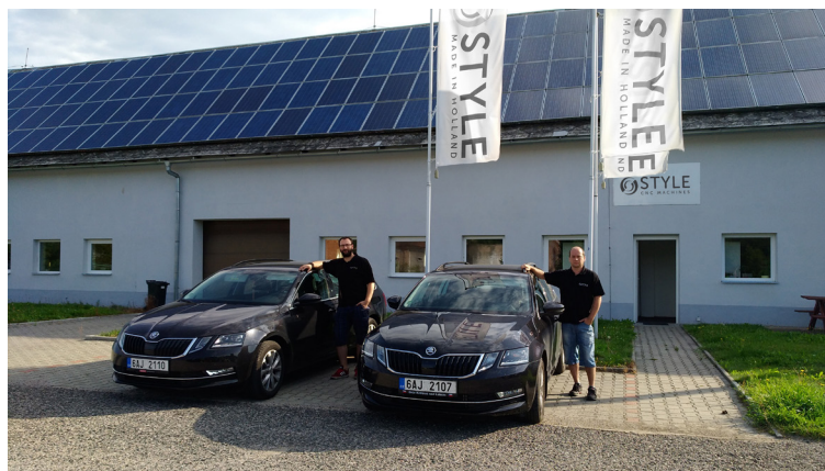
STYLE Česká republika (servis & prodej)

+420 737 418 814 info@stylecncmachines.cz