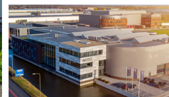
STYLE CNC Nizozemí (montáž, servis & prodej)

Změny cen a/nebo tiskové chyby vyhrazeny.