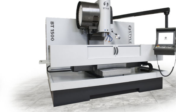
BT 1500 / BT 1500+