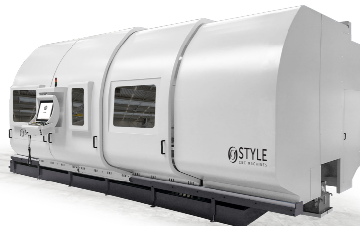
STYLE 1000 ~ 2200