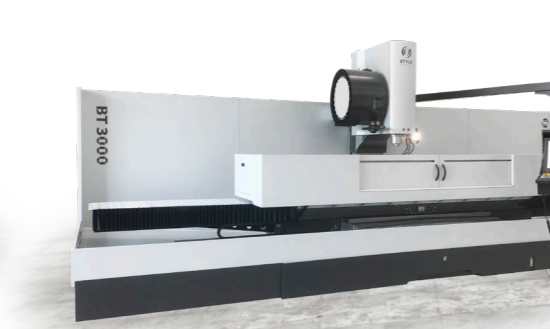
BT 3000 / BT 4000