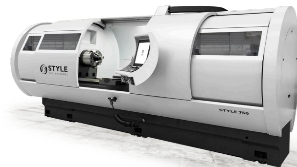
STYLE 650 / 750