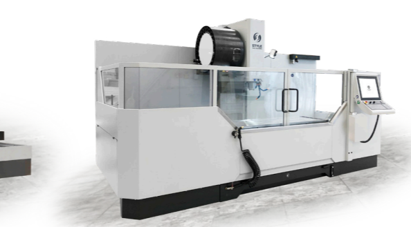
Částečné zakrytování stroje (volitelně)